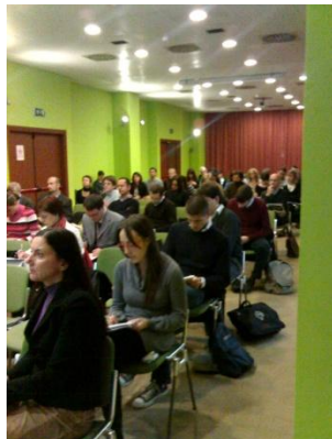
Milano 21 ottobre 2008