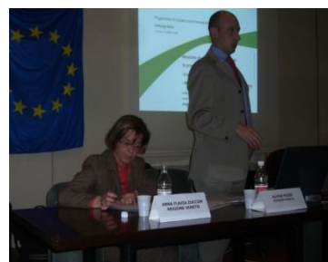
Venezia 27 ottobre 2008