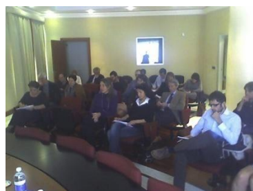
Genova 28 ottobre 2008