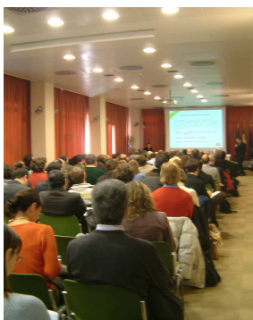
Milano, 4 dicembre 2007

Il materiale presentato è disponibile a richiesta in formato pdf.