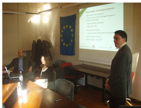
Venezia, 13 dicembre 2007