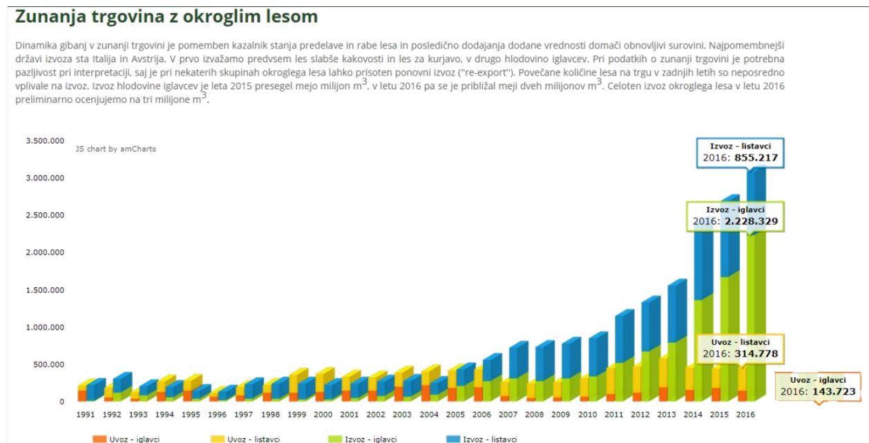
Slika 2: Tokovi okroglega lesa leta 2016