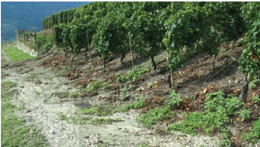
Figura 1: intensa erosione in vigneto dopo un evento temporalesco nel 2012.

L'antica pratica del terrazzamento ha permesso la conservazione dei versanti scoscesi ed ha limitato l'erosione accelerata (Figura 1) e le instabilità di versante. Dove i terrazzamenti non sono presenti, o dove i pendii sono troppo ripidi, l'erosione idrica può portare ad una perdita irreversibile di sedimenti e nutrienti, compromettendo i principali servizi ecosistemici del suolo. L'obiettivo principale per una viticoltura sostenibile in montagna è trovare un compromesso tra la sostenibilità economica e il controllo dell'erosione. Il sito sperimentale è stato progettato per studiare l'erosione nei vigneti in forte pendenza, e per proporre buone pratiche gestionali.