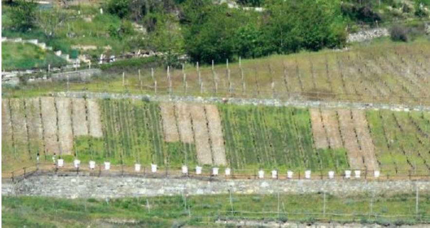
Figura 3: impianto sperimentale. Vista dei filari dal versante opposto. Si osservano chiaramente l'inerbimento vs. diserbo dell'interfila, la presenza di fasce tampone, i dispositivi per la raccolta dei sedimenti.

SOIL MANAGEMENT PRACTICES IN THE ALPS, A selection of good practices for the sustainable soil management in the Alps