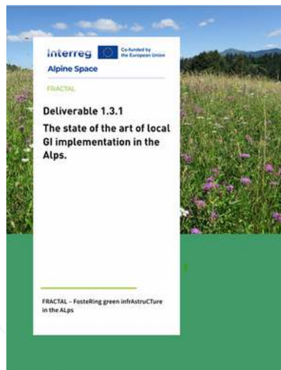
Slika 2: Naslovnica poročila projekta FRACTAL o trenutnem stanju implementacije ZI v Alpah