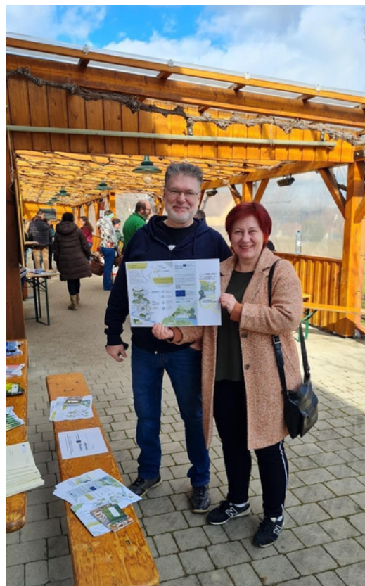
Slika 4: Fotografija iz dneva zelene infrastrukture v avstrijskem kraju Burgenland.

Februarja 2024 je bil v okviru dogodka "Izmenjava semen in gomoljev" izveden drugi Dan zelene infrastrukture. Dogodek je bil informativne narave, zainteresirani sodelujoči pa so uživali v prebiranju FRACTAL brošur in pridobili mnogo novih informacij o načinih izboljšave zelene infrastrukture v mestih in okolici.