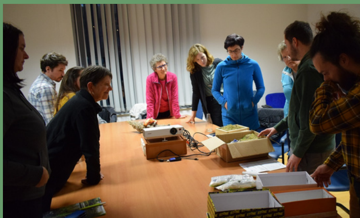
Slika 5: Fotografija iz delavnice o opraševalcih v Sloveniji.

21. februarja 2024 je Posoški Razvojni Center v Tolminu v okviru projekta FRACTAL organiziral delavnico o skrivnostnem življenju čebel samotark in čmrljev. Predavatelji z Nacionalnega inštituta za biologijo so pripravili predavanje o biodiverziteti divjih čebel v Sloveniji, ekosistemski vlogi, ki jo imajo kot opraševalci v naravi, ter njihovi pomembnosti v kmetijstvu. Zainteresirani obiskovalci so sodelovali z vprašanji in se naučili, kako lahko čebelam samotarkam in čmrljem pomagajo v naravi (glej Sliko 5).