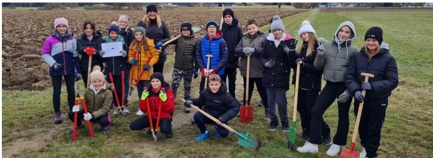
Slika 1: Fotografija iz Dneva zelene infrastrukture v Burgenlandu.