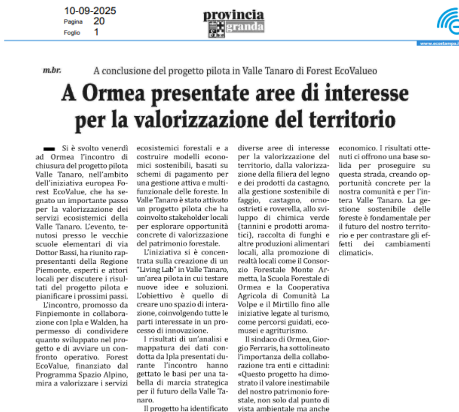
Figure 8: Extract from "La Provincia Granda" regarding the closing of the Italian Living Labs

Both articles underlined the success of the Italian pilot , which tested a participatory model for integrating FES into local value chains and policies. The coverage also detailed the thematic areas prioritised for future valorisation, including: