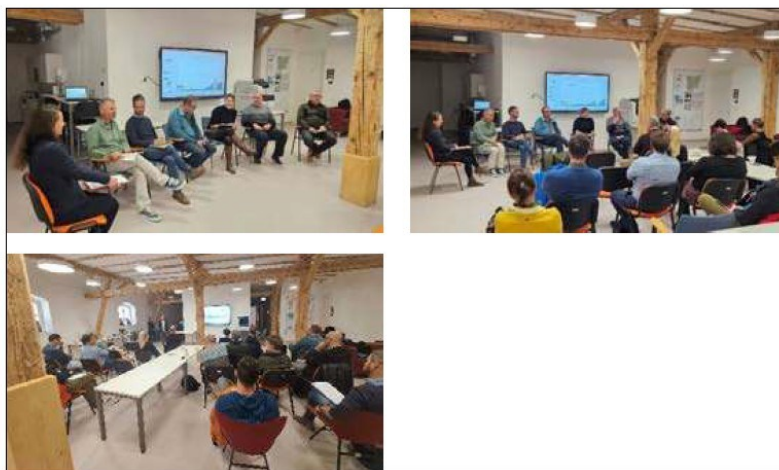
Slika 1: Fotografije z okrogle mize zaključnega dogodka projekta Forest EcoValue

V treh letih projekta smo v občini izvedli več anket, terenskih popisov, intervjujev, analiz stanja, sestankov in delavnic, povezanih z lesno biomaso, varstvom pred škodljivim delovanjem hudournih voda ter rekreacijo in turizmom. Konec novembra 2025 smo organizirali še dogodek, na katerem smo lokalni skupnosti in širši regiji predstavili pomen izbranih funkcij gozda ter prednosti in priložnosti, ki jih le-te ponujajo. Sledila je okrogla