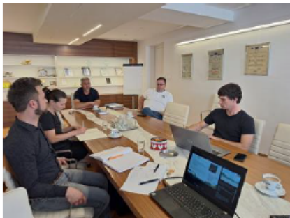
Figure 4: Press release for the launch of the Slovenian Living Lab

https://www.linkedin.com/company/forest-ecovalue